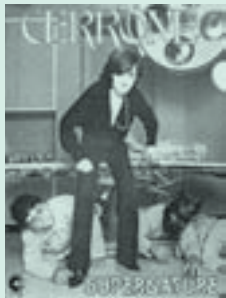
INTE BARA FÖR HIPSTERS LÅNGRE.