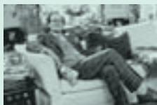
HAKELIUS GENOMSRYD AV KONSERVATISM.

Men i tider av oförblommad nostalgi och Brideshead-backlash känns den där överbrittiska överklassromantiken lite övertydligt möjlig. Unga män talar fullständigt oironiskt om "kvalitet" och värjer sig oreflekterat mot minsta lilla frågetecken kring kopplingarna mellan konservatism och tweed med Johan Hakelius och Mats Svegfors som enda